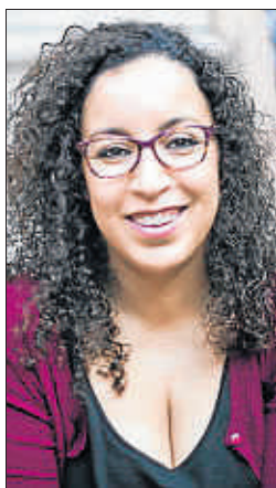
XAVIER CERVERA / ARXIU