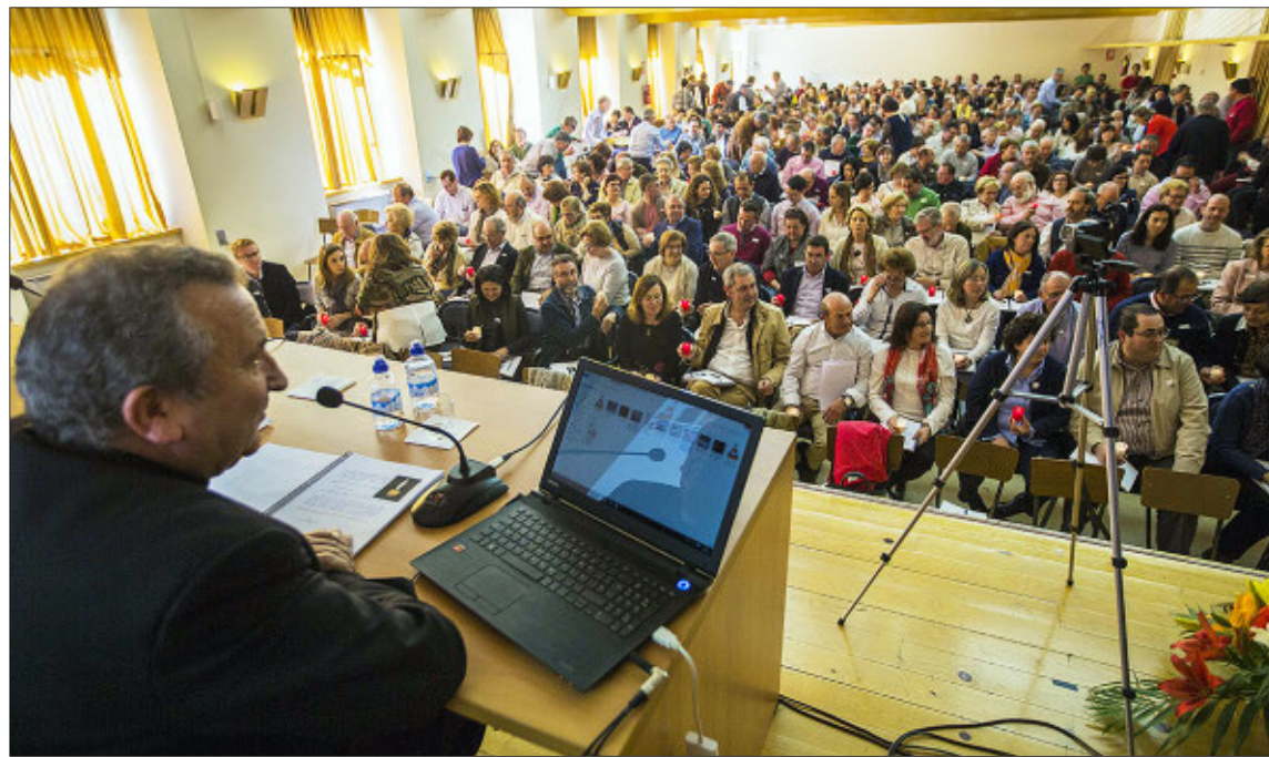
Un momento de la convivencia de matrimonios con el obispo celebrada ayer por la mañana.