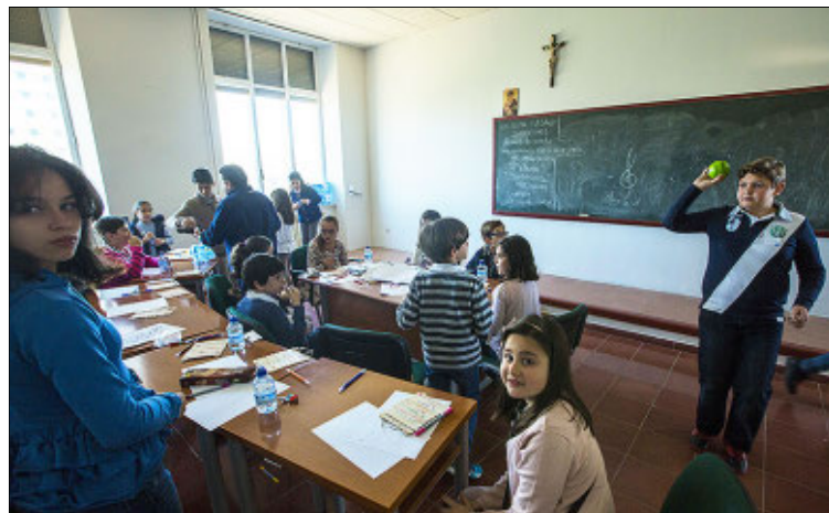
A la jornada, celebrada en el seminario, asistieron también un centenar de niños.