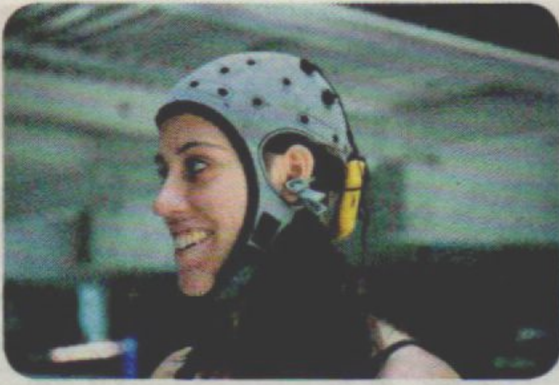
Brain Polyphony Diverses entitats

↑ El Centre de Regulació Genòmica de Barcelona, el Starlab, la Universitat de Barcelona i l'Institut Hospital del Mar d'Investigacions Mèdiques s'han posat d'acord per investigar sobre el Brain Polyphony. El projecte en forma de casc, que s'està provant en usuaris d'Asdi, permetrà als discapacitats amb paràlisi cerebral que no poden comunicar-se, expressar emocions.