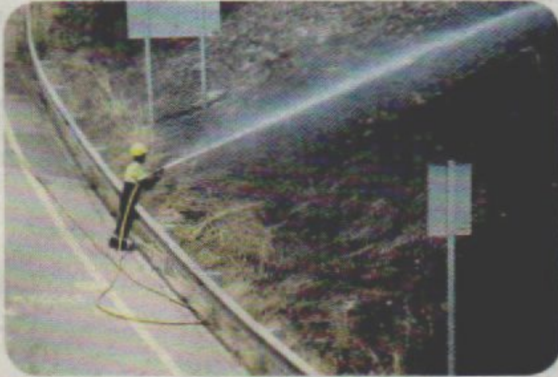
Incendis La calor fa que el risc sigui elevat

↑ El Centre de Regulació Genòmica de Barcelona, el Starlab, la Universitat de Barcelona i l'Institut Hospital del Mar d'Investigacions Mèdiques s'han posat d'acord per investigar sobre el Brain Polyphony. El projecte en forma de casc, que s'està provant en usuaris d'Asdi, permetrà als discapacitats amb paràlisi cerebral que no poden comunicar-se, expressar emocions.