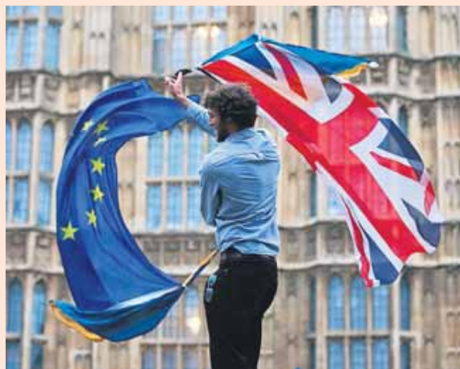
La campanya pel referèndum ha estat intensa al Regne Unit.

racisme i la xenofòbia. Seguidament, les conseqüències de la victòria d'aquestes idees: per ara, el nombre d'agressions de caire racista al Regne Unit s'ha multiplicat per cinc des de la victòria del Brexit i centenars d'immigrants són intimidats i atacats per individus envalentits i autojustificats per la retòrica xenòfoba que s'ha gastat en la campanya, començant per la (ja oblidada?) diputada laborista Jo Cox i seguint per treballadors de tot el món que, des de fa anys, contribueixen al creixement econòmic d'aquell país. Finalment, la crisi política a la UE, que segurament necessita repensar-se a fons,