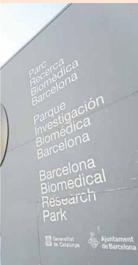
Barcelona i el Port Olímpic. ORIOL DURAN