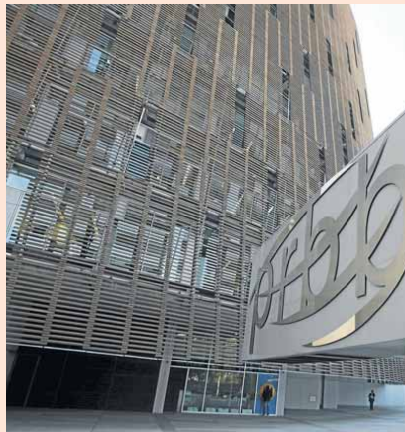
Edifici on s'ubica el PRBB, al passeig Marítim de Barcelona, entre el barris de la Barceloneta i el Port Olímpic

LA SALUT COL·LECTIVA A cap investigador no se li escapa que els serveis científicotècnics compartits al PRBB, com ara un dels dos espectròmetres de masses més precisos del món, una de les unitats de citometria de flux tecnològicament més avançades d'Europa o un dels animalaris europeus més complexos i robotitzats, són una part important del èxit que ha aconseguit el centre, i també un