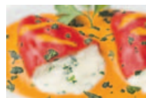
La propuesta de Café Bar Mariño se quedó en 2.º lugar.