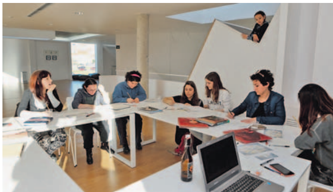
Diseño previo de los bocetos, ayer por la tarde, para después crear el mural en la biblioteca. J. M. CASAL