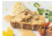
Con esta tapa, Chousa Bella se llevó dos primeros premios.

Las opiniones de los hosteleros ya lo adelantaban el domingo, pero ayer llegaron los datos que confirmaron el éxito del primer concurso A Laracha de Tapas . Durante tres días, este pasado fin de semana, se repartieron unas 5.000 creaciones (a un euro cada una). De los diez participantes, fue el restaurante Chousa Bella, con su Solombo de porco con xamón e queixo do país en follado con salsas de queixos el que se alzó con la puntuación más alta por parte del jurado profesional y, también, por parte del jurado popular (el público), obteniendo así los dos primeros premios en ambas categorías (300 y 200 euros, respectivamente). Según los datos facilitados por el establecimiento al Concello, durante el fin de semana sirvieron 700 tapas y emplearon para ello «47 kilos de solombo». En segundo lugar para el jurado profesional (250 euros) quedó el Pimillao Mariño de Café Bar Mariño. Integraban el equipo encargado de la valoración José Manuel Pato, presidente de honor de la Gran Orden Gastronómica Costa da Morte; Fernando Paredes, de A Ventana de Laxe, y José Antonio Domínguez,