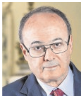
LUIS MARÍA LINDE GOBERNADOR DEL BANCO DE ESPAÑA «Urge retomar la senda de la consolidación fiscal»