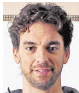
PAU GASOL JUGADOR DE LA NBA «Es un orgullo estar con nuestro equipo nacional y dar alegrías a la afición»