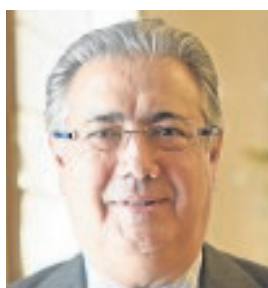
JUAN IGNACIO ZOIDO MINISTRO DEL INTERIOR «Mi mayor logro al frente de Interior sería no tener que comparecer nunca ante los medios para informar de un atentado»