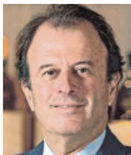
IGNACIO OSBORNE PRESIDENTE DEL INSTITUTO DE LA EMPRESA FAMILIAR «Hay que lograr la simplificación administrativa»