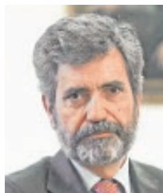
CARLOS LESMES PRESIDENTE DEL TS Y DEL CGPJ «Los jueces son independientes en el ejercicio de su función»