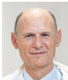
JUAN CARLOS IZPISUA BIOQUÍMICO «Con el desarrollo de la edición genética podemos cambiar el curso de la evolución humana»