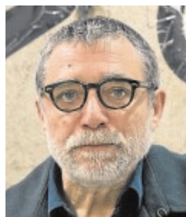
JAUME PLENSA ESCUPTOR «La cultura es, sin duda, la imagen de un país, es la mejor marca que cualquier nación puede tener»