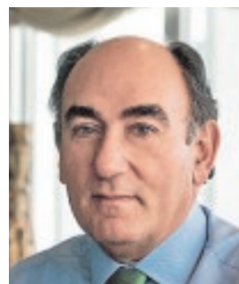
IGNACIO GALÁN PRESIDENTE DE IBERDROLA «El gran desafío del sector es seguir reduciendo las emisiones»