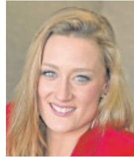
MIREIA BELMONTE NADADORA «El oro olímpico para mí y para España es uno de los logros más satisfactorios»