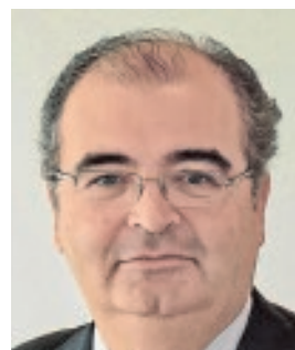
ÁNGEL RON PRESIDENTE DE BANCO POPULAR «El futuro abre nuevas oportunidades para la banca»