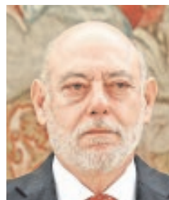
JOSÉ MANUEL MAZA FISCAL GENERAL DEL ESTADO «Tomamos como prioridad la agilización de la Justicia»