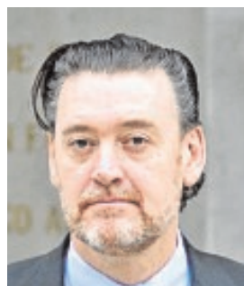
MIGUEL ZUGAZA DIRECTOR SALIENTE DEL MUSEO DEL PRADO «No hay Ministerio, pero da tranquilidad tener un ministro que cuida el Prado»

IGLESIA La crisis ha sido la mejor prueba de la enorme labor solidaria de la Iglesia