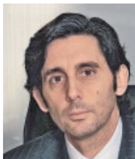
JOSÉ MARÍA ÁLVAREZ-PALLETE PRESIDENTE DE TELEFÓNICA «Las empresas afrontan una gran transformación»