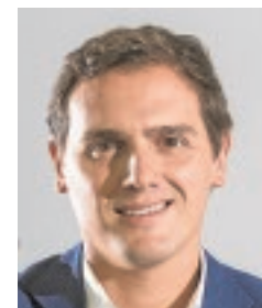
ALBERT RIVERA PRESIDENTE DE CIUDADANOS «No creo que nadie piense en desestabilizar otra vez el país»