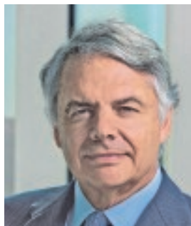
IGNACIO GARRALDA PRESIDENTE DE MUTUA MADRILEÑA «El Gobierno debe tener cintura para sacar adelante las reformas»