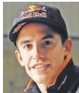
MARC MÁRQUEZ PILOTO DE MOTOGP «Los jóvenes deben dejarse aconsejar; es la mejor forma de aprender»