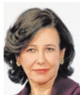
ANA BOTÍN PRESIDENTA DE BANCO SANTANDER «Hay que hacer que España sea el mejor país para emprender»