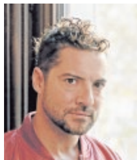
DAVID BISBAL CANTANTE «Por supuesto, pienso que somos un país privilegiado»