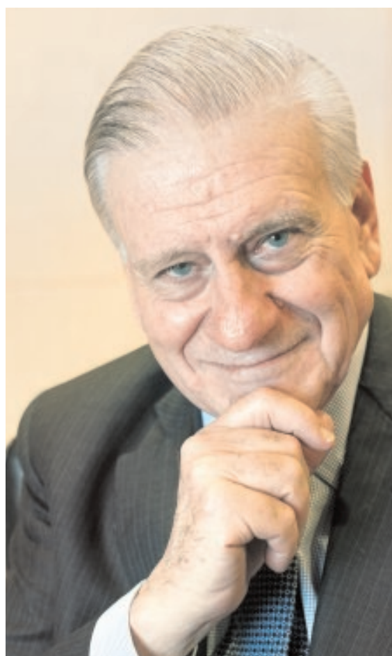
VALENTÍN FUSTER DIRECTOR DEL CENTRO DE INV. CARDIOVASCULARES «Promover la salud será más económico que tratar la enfermedad»

De la creación artística, Jaume Plensa, tal vez la figura española con mayor penetración internacional. De la cinematografía traemos a Rodrigo Cortés, que ha dirigido a grandes estrellas de Hollywood y última su nueva película. Y en la música David Bisbal, el artista que dio cuerpo al sueño televisivo que ha formado a una nueva generación de figuras.