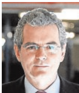
PABLO ISLA PRESIDENTE DE INDITEX «Inditex ha generado 6.000 empleos en España en los dos últimos años»