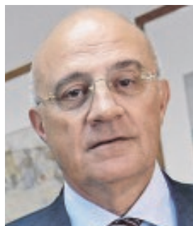
JOSÉ OLIU PRESIDENTE DE BANCO SABADELL «España sigue enfrentándose a importantes retos estructurales»