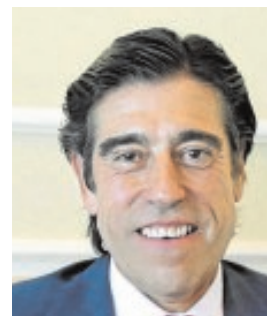
MANUEL MANRIQUE PRESIDENTE DE SACYR «Tenemos la esperanza de que en España pueda repuntar la inversión»