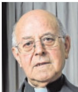
RICARDO BLÁZQUEZ PRESIDENTE DE LA CONFERENCIA EPISCOPAL «Es necesario afrontar de una vez una ley de Educación consensuada»