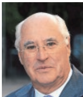
RAFAEL MIRANDA PRESIDENTE DE ACERINOX «Nuestras expectativas pasan por superar los resultados de 2016»