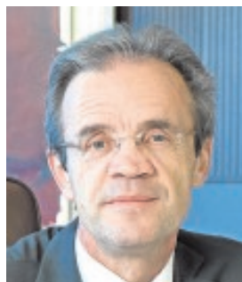
JORDI GUAL PRESIDENTE DE CAIXABANK «Generar empleo, y de calidad, es clave para la cohesión social»