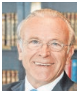
ISIDRO FAINÉ PRESIDENTE DE GRUPO LA CAIXA Y GAS NATURAL FENOSA «Hay ciertos focos de dudas globales que preocupan»