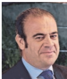
GABRIEL ESCARRER VICEPRESIDENTE Y CEO DE MELIÁ HOTELS «El diálogo que busca el Gobierno no debe penalizar a la gran empresa»