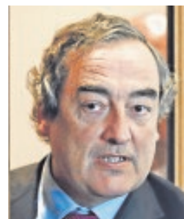
JUAN ROSELL PRESIDENTE DE CEOE «Es momento de afrontar una agenda económica y social que impulse España»