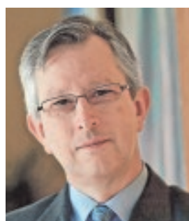
JOAN MASSAGUÉ DIRECTOR DEL SLOAN-KETTERING INSTITUTE «Queremos controlar el cáncer como las infecciones»