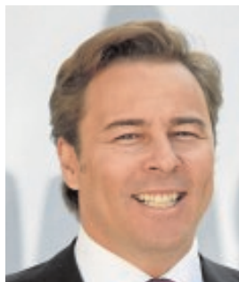
DIMAS GIMENO PRESIDENTE DE EL CORTE INGLÉS «Es vital que se logre la unidad de mercado en España»