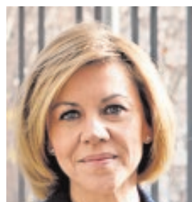
MARÍA DOLORES DE COSPEDAL MINISTRA DE DEFENSA «Es un momento crucial para la construcción de la Defensa Europea. Hay que actuar de forma decidida»