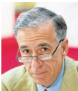
GONZALO URQUIJO PRESIDENTE DE ARCELORMITTAL ESPAÑA «Confiamos en que la demanda de acero se recupere»