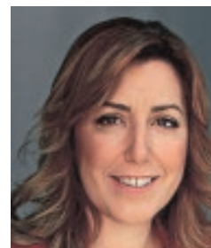
SUSANA DÍAZ PRESIDENTA DE LA JUNTA DE ANDALUCÍA «2017 va a ser el año del fortalecimiento del PSOE»