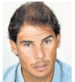
RAFA NADAL TENISTA «Soy una persona positiva y siempre pienso que las cosas mejorarán»