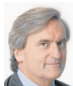
ROMÁN OYARZUN EMBAJADOR DE ESPAÑA ANTE LA ONU «El impacto de las decisiones es más alto cuanto más apoyos»