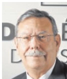
JOSÉ FOLGADO PRESIDENTE DE RED ELÉCTRICA DE ESPAÑA «El Brexit y la Administración Trump generan incertidumbres»