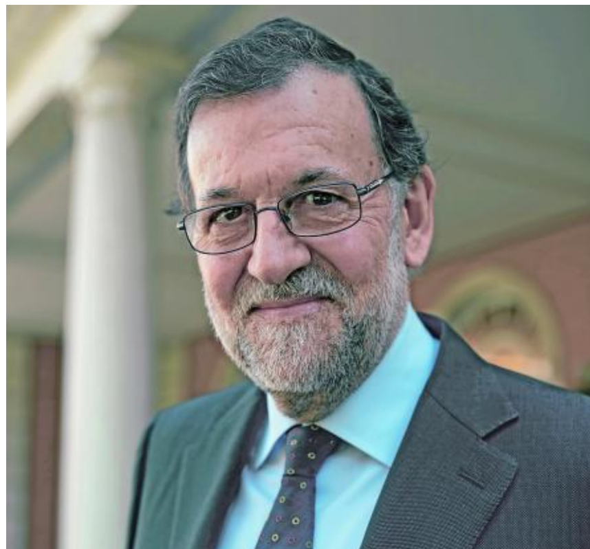
MARIANO RAJOY PRESIDENTE DEL GOBIERNO

«No podemos poner en riesgo la recuperación económica por circunstancias políticas»