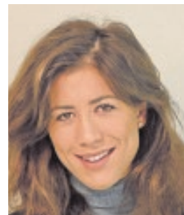
GARBIÑE MUGURUZA TENISTA «Procuro que la autoexigencia no se convierta en presión»