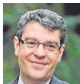
ÁLVARO NADAL MINISTRO DE ENERGÍA Y AGENDA DIGITAL «Este año, las perspectivas del sector turístico son todavía mejores que las de 2016»