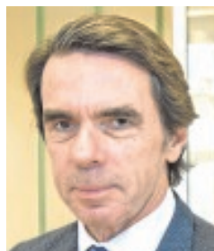
JOSÉ MARÍA AZNAR PRESIDENTE DE FAES «Los acuerdos de Estado no son posibles sin objetivos comunes»

ABC ofrece mañana gratis a sus lectores un número especial que reúne a cien personalidades del mundo de la economía, la empresa, el derecho, la política, la ciencia, la cultura, la Iglesia o el deporte y les ha preguntado por sus proyectos y previsiones para 2017. ABC reconoce en 100 nombres lo mucho de excelente que tiene España y que merece darse a conocer, ya que también es motivo de orgullo por parte de todos.