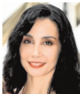
TAMARA ROJO BAILARINA «Se ha generado desasosiego entre los emigrantes y los empresarios con la llegada del Brexit»