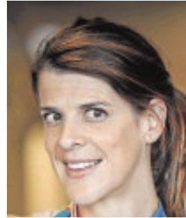
RUTH BEITIA SALTADORA DE ALTURA «Hemos sabido resurgir tras la crisis y tenemos un gran futuro como país»

DEPORTISTAS El espíritu de sacrificio y superación es el denominador común