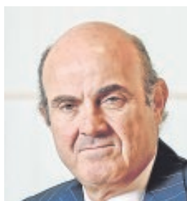
LUIS DE GUINDOS MINISTRO DE ECONOMÍA Y COMPETITIVIDAD «España debe insistir en las reformas para mantener nuestro diferencial de crecimiento»