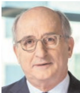
ANTONIO BRUFAU PRESIDENTE DE REPSOL «El gran reto es lograr la sostenibilidad de la recuperación económica»