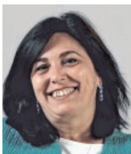
ROSA GARCÍA PRESIDENTA DE SIEMENS ESPAÑA «Urge un pacto social que fomente una formación más adecuada»