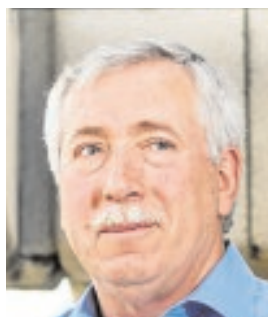
IGNACIO FERNÁNDEZ TOXO SECRETARIO GENERAL DE COMISIONES OBRERAS «Tener un trabajo hoy no supone salir de la pobreza»