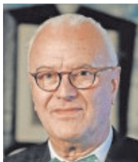
MANOLO BLAHNIK DISEÑADOR «Me enorgullece que, en un sector lleno de grandes grupos, mi marca permanezca independiente»