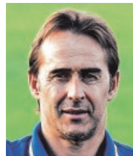
JULEN LOPETEGUI ENTRENADOR DE LA SELECCIÓN «No podemos mirar atrás. Ahora hay que afrontar nuevos retos»