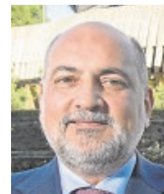
FRANCISCO PÉREZ DE LOS COBOS PRESIDENTE DEL TC «La reforma de la Constitución debe hacerse con reflexión»