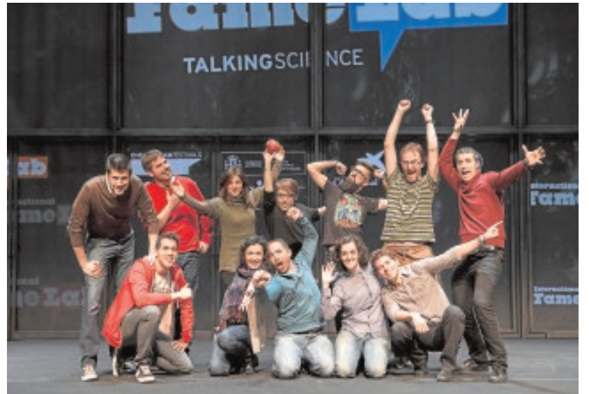
Los doce semifinalistas del concurso de Famelab 2015

A lo largo del año pasado se dictaron un total de 46.313 sentencias relacionadas con malos tratos en el ámbito familiar: un 61,2% de ellas fueron condenatorias.