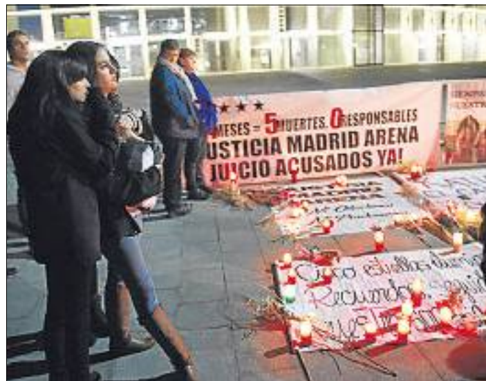
ALBERTO MARTÍN / EFE

MEDIO AMBIENTE ▶ Dentro de plan de recuperación y conservación de aves necrófagas, la Consejería de Medio Ambiente ha detectado la presencia de al menos 325 parejas de buitre negro en Andalucía. Estos datos confirman, según la Junta de Andalucía, el "éxito reproductor" de la especie en la última década debido al citado programa puesto en marcha. Desde el 2010 la situación de la especie ha pasado de considerarse "en peligro" a "vulnerable". / Efe