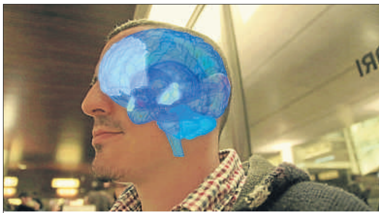
La missió de Formas Naturales és fer accessible i entretinguda la ciència

Formas Naturales, que ocupa cinc persones i va rebre l'assessorament de la Secot, preveu facturar 140.000 euros aquest any.