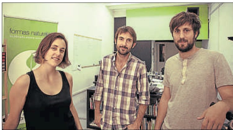
Els tres fundadors de Formas Naturales