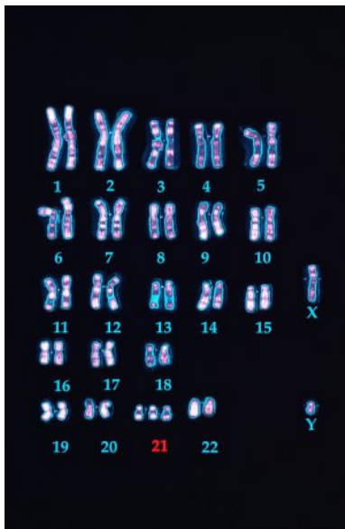
Cromosomas de un varón con síndrome de Down donde se ven las tres copias del 21.

Archivado en: Síndrome Down Investigación médica Enfermedades genéticas Genética Biología Investigación científica Enfermedades Ciencias naturales Medicina Ciencia Salud