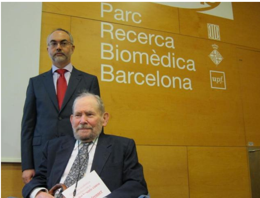
La UPF inviste 'honoris causa' al británico Sydney Brenner, Nobel de Medicina en 2002 Temas