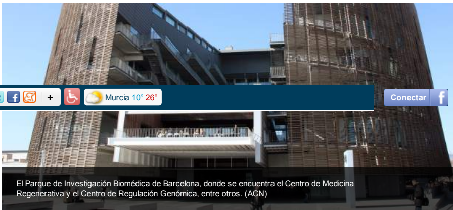
El Parque de Investigación Biomédica de Barcelona, donde se encuentra el Centro de Medicina Regenerativa y el Centro de Regulación Genómica, entre otros.