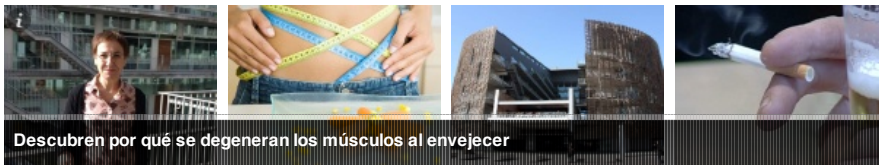
Descubren por qué se degeneran los músculos al envejecer