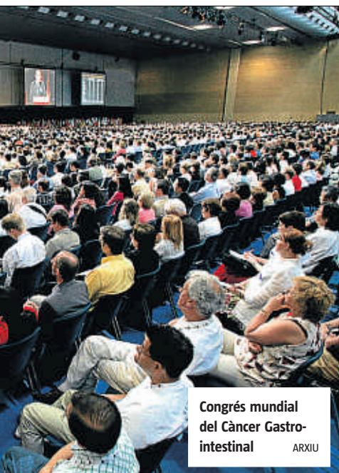
Congrés mundial del Càncer Gastrointestinal

latinoamericans com ara Mèxic, Colòmbia o l'Argentina. "La nostra intenció, a través del programa Tok-Toc, és aconseguir nous inversors que ens permetin llançar Sangakoo en mercats en els quals creiem que podria tenir molt d'èxit, com l'alemany o el suec, en els quals les matemàtiques tenen molt de pes", conclou.