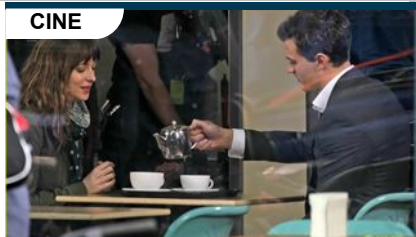
CINE '50 sombras de Grey': Primeras fotos del rodaje