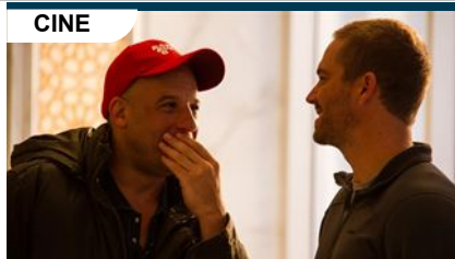
CINE Vin Diesel rinde homenaje a Paul Walker: "Eras un hermano dentro y fuera de la pantalla"