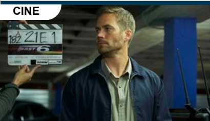
CINE ¿Qué pasará con Fast & Furious 7 tras la muerte de Paul Walker?