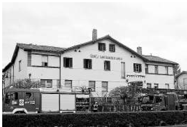
Actuación de bomberos en la vieja clínica de Pamplona.

Bomberos del parque de Cordovilla actuaron ayer por la mañana para atajar el humo que emanaba de la cubierta de un edificio en desuso de Pamplona, en concreto, de la que fuera sede de la clínica San Francisco Javier, en la avenida Baja Navarra 52 de la capital. Vecinos de la zona alertaron de la presencia de humo en la zona abuhardillada, en la planta superior del edificio, y al acceder los bomberos a la misma comprobaron que estaban ardiendo varios trapos, papeles y otros residuos orgánicos. El recinto, cerrado con candado, se encontraba vacío cuando llegaron los efectivos de Emergencias aunque había constancia de que el mismo había estado ocupado recientemente por personas. La Policía Municipal de Pamplona se encarga de investigar el origen del humo y de vigilar este edificio abandonado. >E.C.