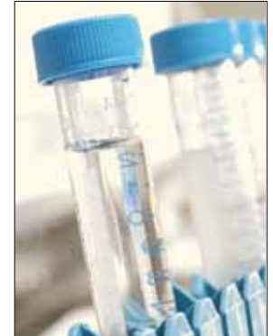
Ensayan con velaglucerasa alfa en ELA.

“El estudio recoge información de los resultados clínicos de determinadas pruebas y determinaciones analíticas, y de los efectos del tratamiento, y facilita