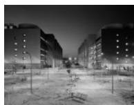
Homenaje póstumo al fotógrafo de las ciudades mediterráneas