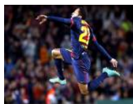
El problema del central puede tener a Adriano como solución