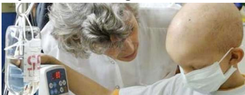
Un niño durante su tratamiento contra la enfermedad.