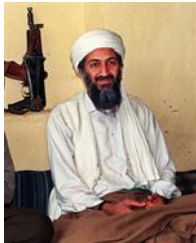
Sólo dos de los 25 comandos de los SEAL que mataron a Bin Laden continúan vivos