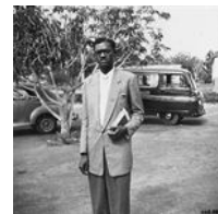
El MI6 británico habría asesinado a Patrice Lumumba en la Guerra Fría