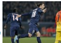
Alto precio por empatar en París