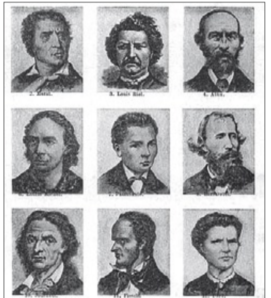
'L'HOMME DELINQUENT' ▶ Cares de revolucionaris (Marat és el primer de la làmina) i criminals en el llibre de Lombroso.

expandir d'Alemanya a França, Escòcia i els Estats Units. Però ja a mitjans del segle va començar a perdre pes, al no aconseguir identificar els òrgans del cervell. Però no es va acabar. El 1876, el llibre L'home delinqüent , del metge i frenòleg italià Cesare Lombroso, va establir les bases de la criminologia. «Les empremtes dactilars i les fotografies criminals expressen el desig de classificar els delinqüents sobre la base dels seus trets», assegura Nofre. També les teories racistes van abraçar la frenologia, que va tornar a prosperar a l'Alemanya nazi, amb plans per a selecció de l'home ideal.