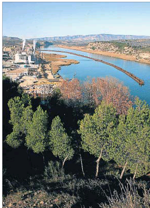
El Ebro a su paso por Flix, con la fábrica de Ercros junto al pantano

Las últimas analíticas detectan niveles de contaminación de origen industrial "inadmisibles" desde Flix hasta el delta