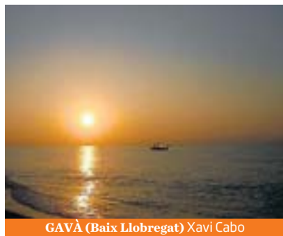
GAVÀ (Baix Llobregat) Xavi Cabo