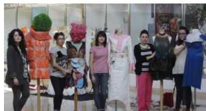
Texvigo es moda