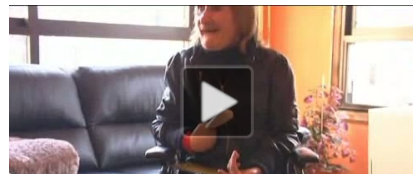
Dos hermanas de San Sebastián enseñan a escribir con los ojos