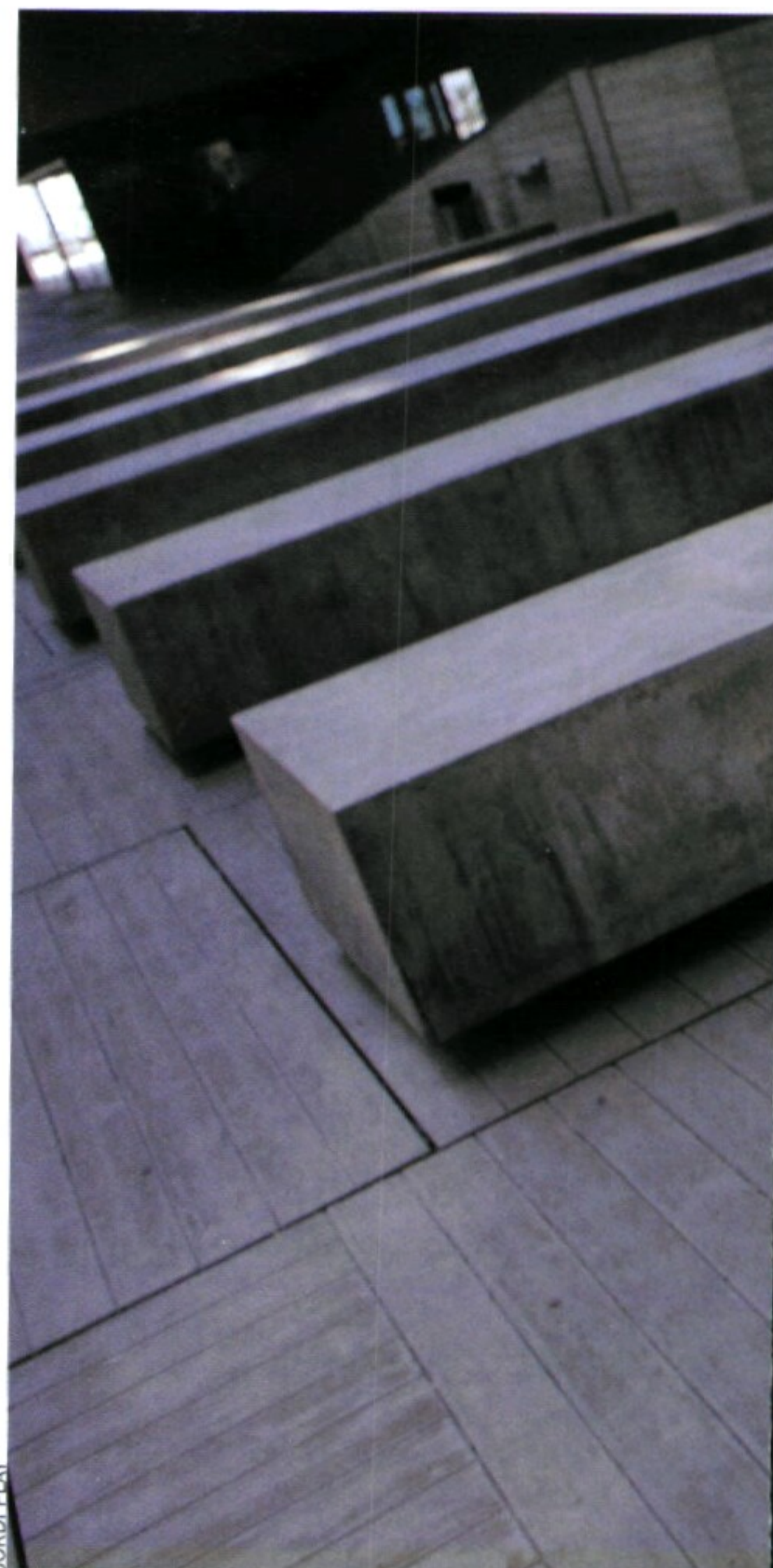
JORDI PLAY “Tots els processos relacionats amb la semàn-

—Exacte. Per molt que es moderi per l'ús d'anticonceptius, biològicament es continua manifestant en coses més subtils. Per exemple, es va fer un estudi fa poc en què es veia que, fins i tot en contactes sexuals esporàdics, la dona tendia més a avaluar la possibilitat de futur després d'una relació sexual. Tendia a considerar més l'opció de futur. Encara que no hi hagi risc d'embaràs, la implicació emocional que comporta el fet de tenir sexe és diferent en dones i homes.