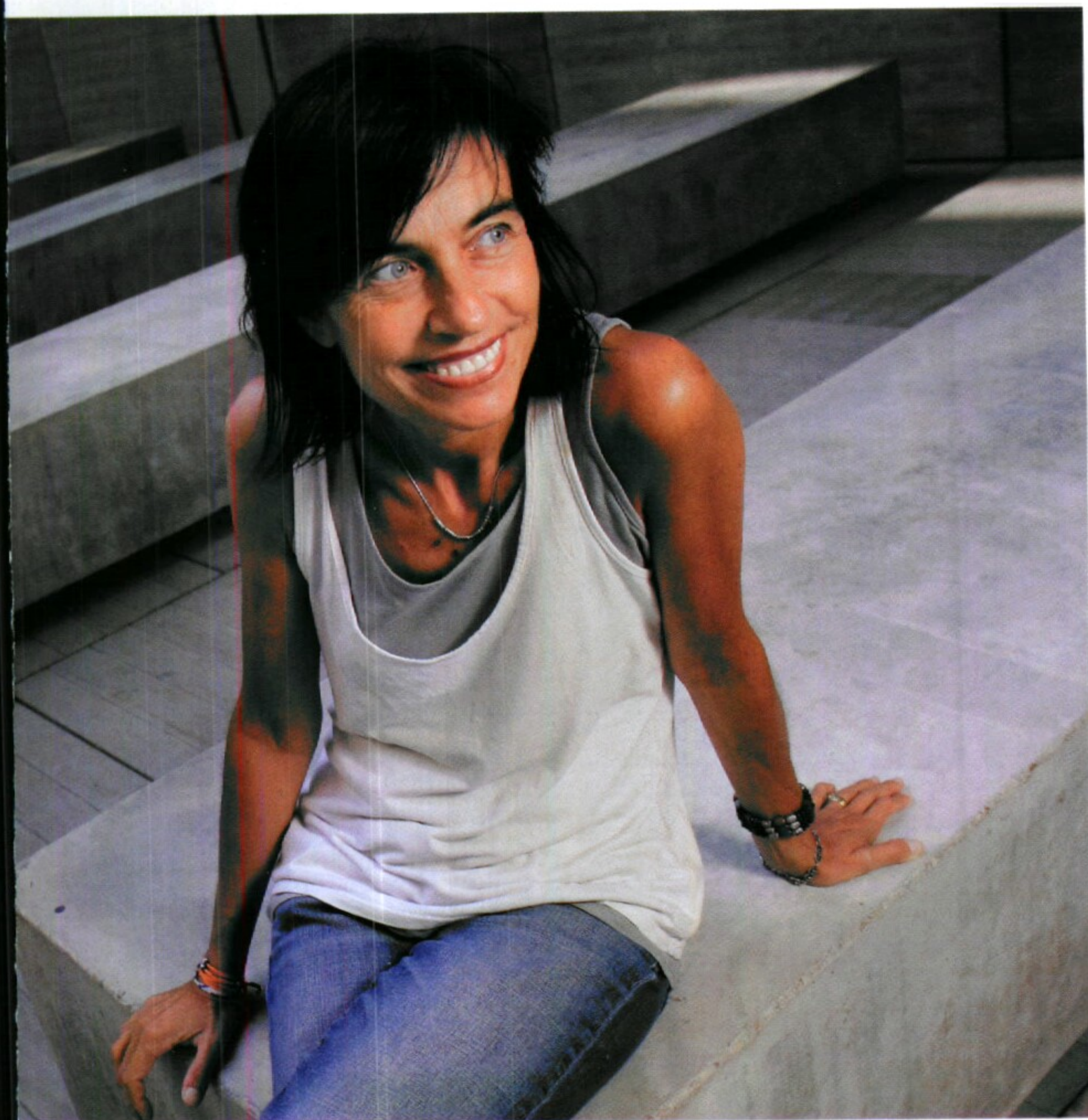
tica produeixen una activació més àmplia en el cervell de la dona que no en el de l'home"

la dona tendeix més al lideratge cooperatiu mentre que l'home tendeix més al lideratge per imposició. Sembla que pugui haver-hi una certa base biològica, tot i que la dona també pot aprendre l'altra classe de lideratge. Potser hem de començar a valorar uns altres estils.