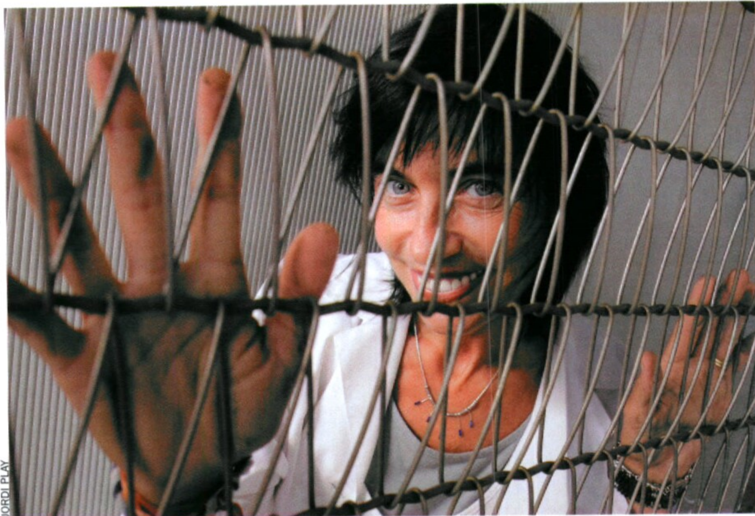
“Les hormones sexuals influeixen en la manera com es diferencien les neurones, en la manera com es connecten, en el seu nivell de plasticitat”

—Sí, la depressió afecta més les dones. La qüestió és en quina mesura la construcció diferent del sistema emocional, de la qual hem parlat abans, influeix en la susceptibilitat a aquestes malalties, independentment que després hi hagi elements genètics que també siguin afectats de manera diferent en l'un i en l'altre. Sí que es veu que hi ha elements genètics que es troben més en homes que no en dones o a l'inrevés.