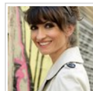
Cristina Perales, cantante y actriz, 40 años