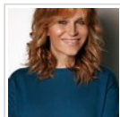
Antonia San Juan, actriz, 49 años