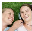
◀ Mujeres admirables: una década de cambios