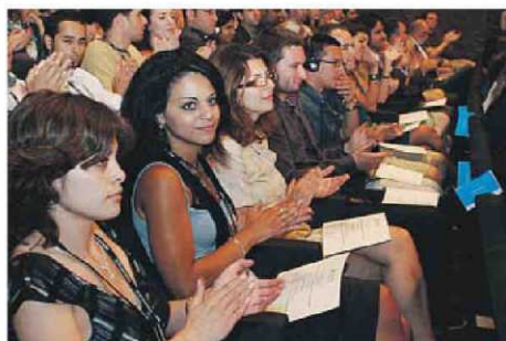
Estudiantes extranjeras sucumben a la tentación española.