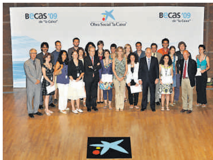
La ministra Cristina Garmendia presidió la entrega de becas