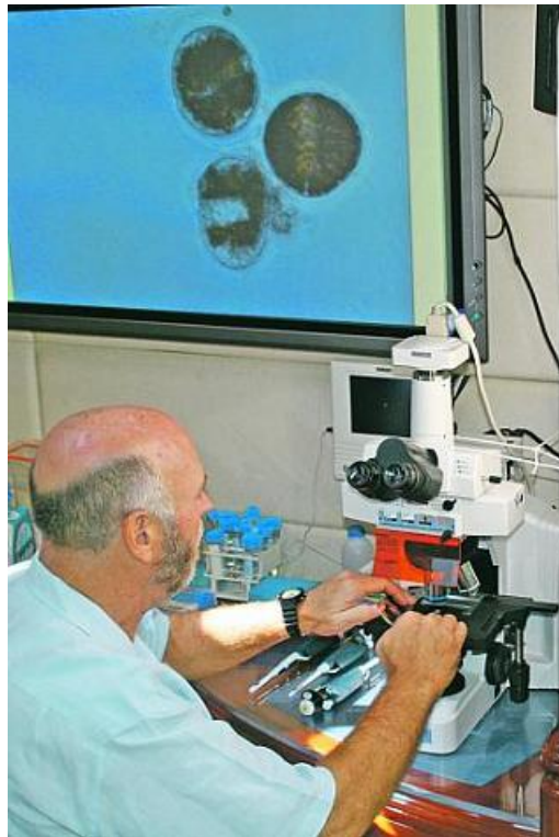
Craig Venter, trabajando en el laboratorio.

Los resultados hasta ahora son puramente a nivel de investigación básica, detalló este investigador, quien señaló que el trabajo permitirá «añadir y quitar genes del genoma de una de estas bacterias y, por tanto, analizar su función».